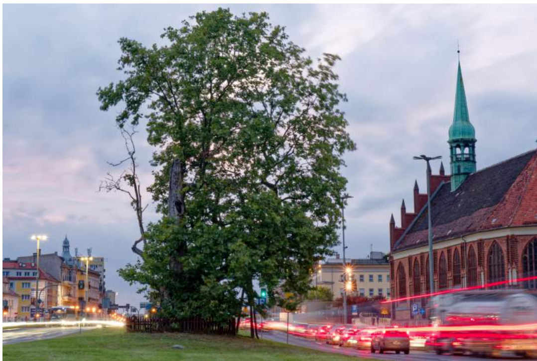
Szczecin, platan DRZEWO MIŁOŚCI, pomiędzy dwiema nitkami Trasy Zamkowej, fot. Sławek Prorok, 2023.

Zobacz inne projekty Stowarzyszenia Nasze Wycieczki: