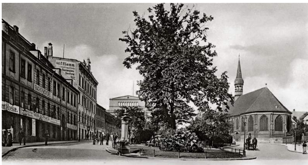
Szczecin (Stettin), ulica Klosterhof, około 1906.