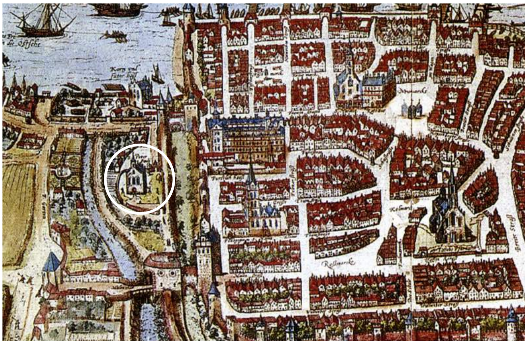
Fragment Widoku Szczecina Fransa Hogenberga, publ. 1594, akwaforta kolorowana ze zbiorów Muzeum Narodowego w Szczecinie.

Białym okręgiem jest zaznaczony kościół pw. św. Apostołów Piotra i Pawła.