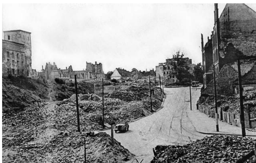
Szczecin, ulica Słoneczna, 1947-48, źródło - Archiwum Państwowe w Szczecinie.