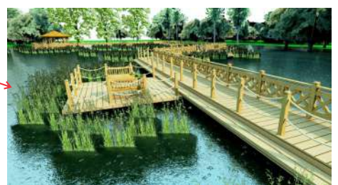
4. Pomost z miejscem wypoczynkowym