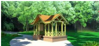
5. Wiata prostokątna