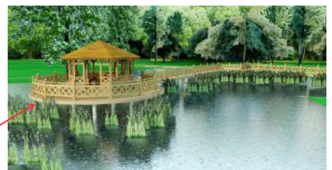
2. Pomost widokowy z wiatą sześciokątną