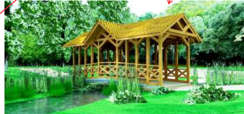
7. Mostek z zadaszaniem