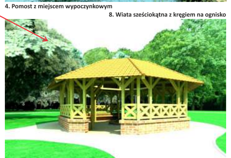
8. Wiata sześciokątna z kregiem na ognisku