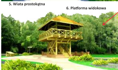
6. Platforma widokowa