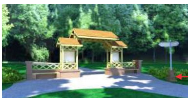
1. Brama trójdzielna z planszami

Druga część Syrenich Stawów jest położona między stadionem 'Arkonía' a ulicami Arkońską, Fałata i Poziomkową. Prowadzą tu dzikie ścieżki, którymi czasami ktoś się zapyści depcząc cenne stanowiska przyrodnicze rodzimych gatunków roślin chronionych. Ochronę przyrody z jednoczesnym umożliwieniem rekreacji zakłada koncepcja rewitalizacji pn. Syrenie Stawy 2. Projekt powstał w pracowni projektowej 'Grupa MGM' Sławomira Adrańskiego i nawiązuje do rewitalizacji pierwszej części Syrenich Stawów przeprowadzonej w 2018 roku po drugiej stronie ulicy Poziomkowej. Połączone części Syrenich Stawów obejmowałyby 24 hektary. Były to największy ogólnodostępny obszar parkowo - rekreacyjny w Szczecinie, który w naturalny sposób zespółiłby Park Kasprowicza z Parkiem Leśnym Arkońskim, przez co szybko stałby się celem wycieczek dla rowerzystów, spacerowiczów, mieszkańców i turystów odwiedzających Szczecin.