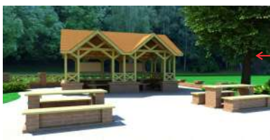
3. Wiata ze stołem i ławkami - mała gastronomia